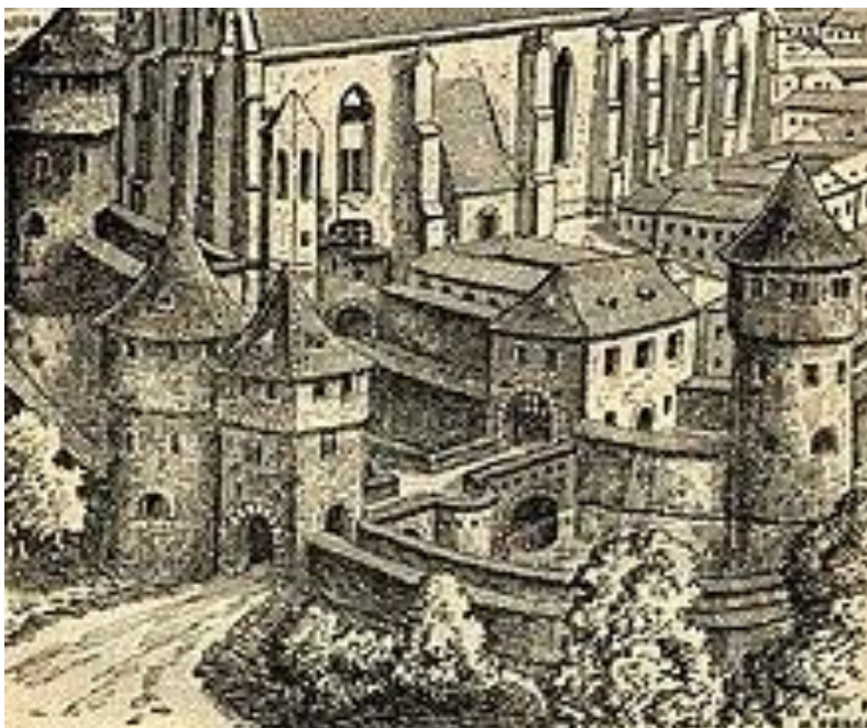
Vydrická brána /1434 – 1777/

Výstavba mosta SNP sa začala kvôli zabezpečeniu prístupu do novovybudovaného sídliska v Petržalke cez Dunaj. Počas nej sa zničila časť Starého Mesta, Rybné námestie, podhradie aj so židovskou štvrťou. Most začali stavať v roku 1967. Cestnú premávku na ňom začali už v roku 1972. Kompletne bol dokončený aj s kaviarňou Bystrica (v 80 m výške týčiacou a točiacou sa tanierovitou stavbou) v roku 1974. Dĺžka mosta (spojitý oceľový nosník) je 432 m, dĺžka cesty premostenia je 303 m a šírka mosta je 21 m.