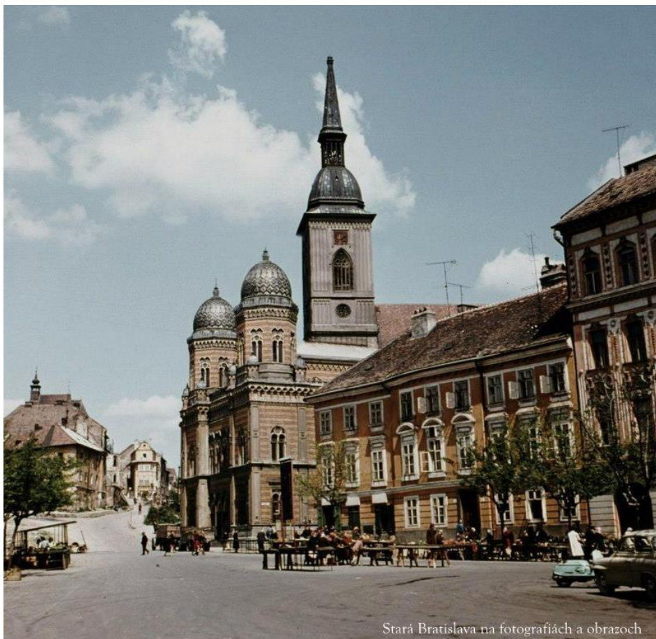
Stará Bratislava na fotografiách a obrazoch