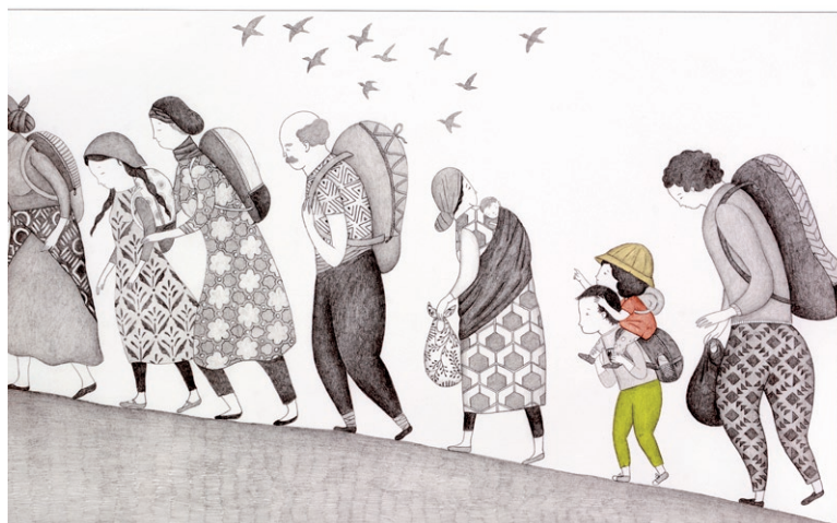
Čínsky ilustrátor Chao Zhang má Zlaté jablko za knihu Slečnice mojej babky . Ghazal Fatollahi z Iránu má Plaketu BIB 2021 za knihu o emigrácii Ste prieskumník .

Španielska - získala Grand Prix BIB 2021. Svoji mi čiernobielymi kresbami ceruzkou priniesla niečo celkom nové, originálny layout, rozloženie detailov a celkovej kompozície. Balansuje na hranici reálneho a surreálneho sveta. Ponúka nový spôsob čítania a robenia obrázkovej knihy, s mnohými variáciami rozprávania príbehu. Je to originálna grafická a naratívna hra, ktorá vŕhne čitateľa k opakovanému čítaniu. Ukazuje viditeľný i neviditeľný život obyvateľov domu, 15 izieb - zarámovaných okien - zachytáva každodenné scény zo života, charakter, emócie obyvateľov domu, každodenné zážitky bežného života.