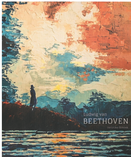
Čestné uznanie získalo české vydavateľstvo Verzone.

BIB otvára Slovensku dvere do sveta už vyše polstoročie. V mnohých kútoch sveta neraz najprv poznali logo BIB a až potom Slovensko. Profesionálne odborné a organizačné zázemie