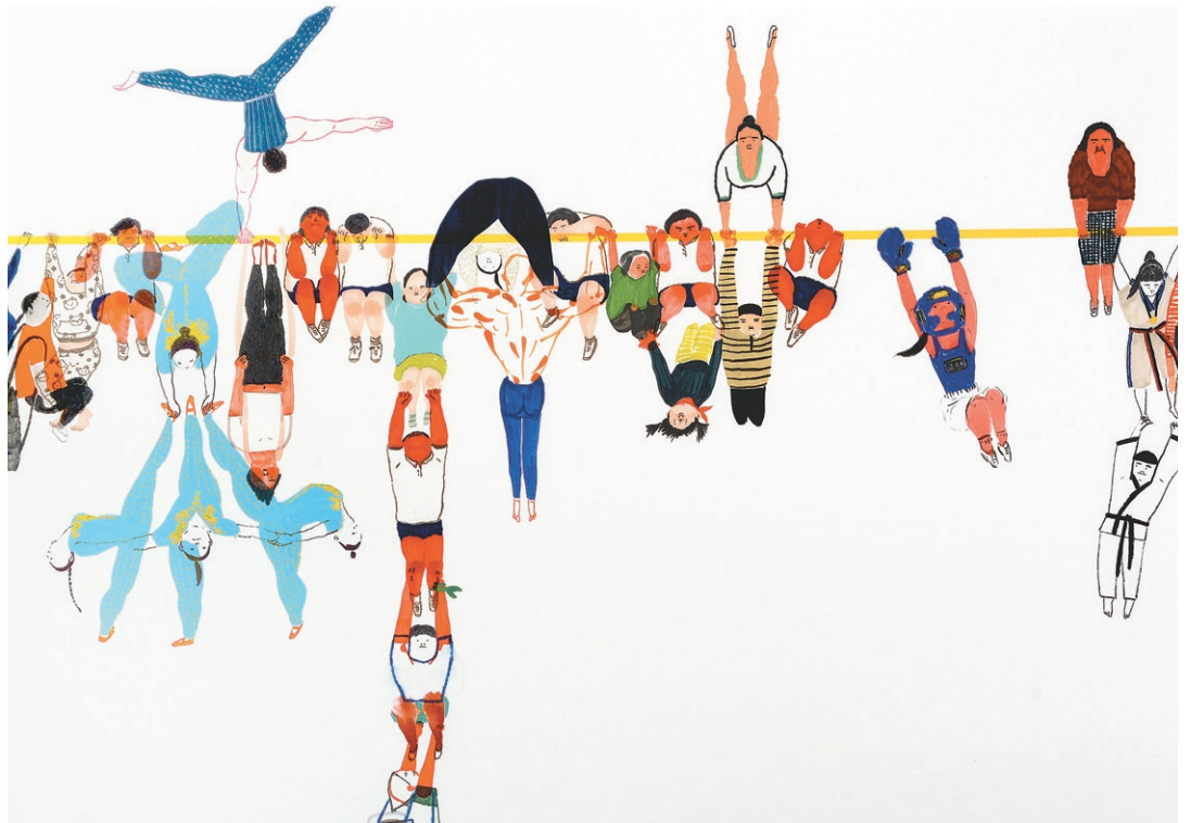
Zlaté jablko má aj Myung Ae Lee z Južnej Kórey za knihu Zajtra bude slnečný deň .