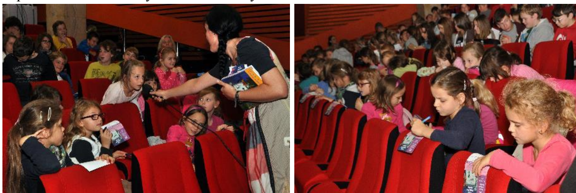
Deti hodnotia súťažné filmy v kine Lumiére

Festival rozšíril aktívne pôsobenie na detského diváka a súťažné premietania prišli po prvý raz za deťmi nielen na veľké bratislavské sídliská, čo bola novinka v roku 2012 (Dom kultúry Zrkadlový háj, Dom kultúry Dúbravka), ale aj do 2 miest mimo mesta Bratislava, do Skalice a Prievidze . Uviedli sme 56 súťažných filmov z 27 krajín za mimoriadneho záujmu i spontánneho ohlasu vyše 10 000 detských divákov.