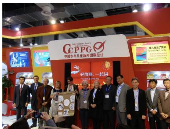
Medzinárodný knižný veľtrh detskej knihy v Šanghaji (Čína)

Bol to prvý spoločný projekt BIBIANY a Čínskej sekcie IBBY v spolupráci s čínskym vydavateľstvom kníh pre deti CCPPG z Pekingu . Výstava sa stretla s veľkým ohlasom u návštevníkov veľtrhu a predpokladáme, že naša spolupráca bude pokračovať aj naďalej.