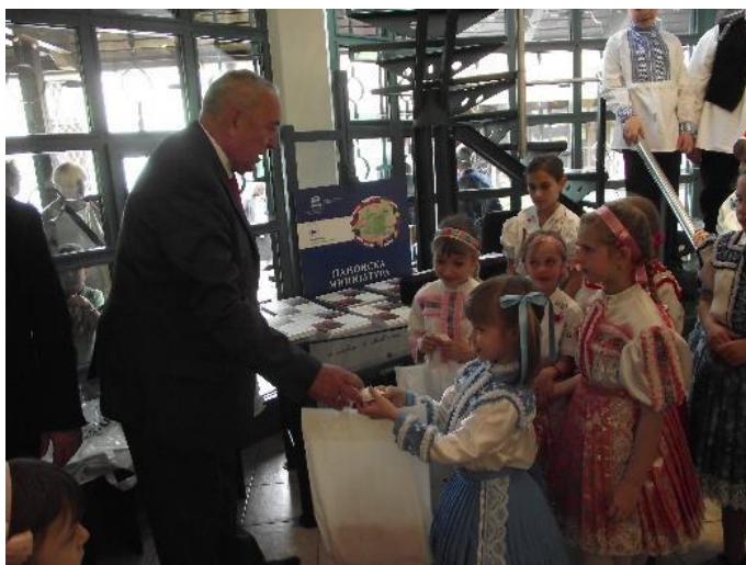
Základná škola Jána Čajaka v Báčsky Petrovec