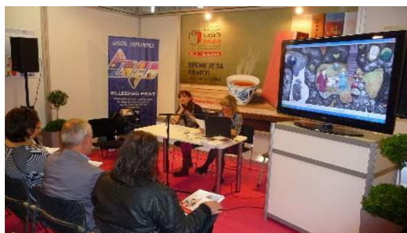
Knižný veľtrh v Belehrade v Srbsku

Je už tradíciou, že pripravujeme výstavy v Srbsku na Knižnom veľtrhu v Belehrade . Tentoraz sme okrem aktuálnej prezentácie Ilustrátori ocenení na BIB 2013 uskutočnili aj prednášku pod názvom Vývin slovenskej ilustrácie v kontexte BIENÁLE ILUSTRÁCIÍ BRATISLAVA 1967 -2013 . Zúčastnilo sa na nej množstvo záujemcov z výtvarnej oblasti, ako aj študenti slovenského jazyka z Filozofickej fakulty Belehradskej univerzity .