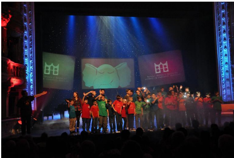
Otvorenie BAB 2014 v SND

V roku 2014 sme pripravili úspešne 12. ročník Medzinárodného festivalu animovaných filmov pre deti BIENÁLE ANIMÁCIE BRATISLAVA, ktoré sa uskutočnilo v dňoch 6. – 10. októbra.