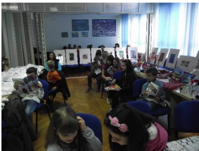
Základná škola Ludovíta Štúra v Kysači v Srbsku